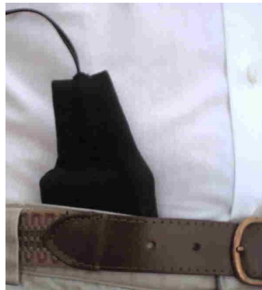
Einfache Handhabung des Sensors

Auf der Anzeige des Gerätes wird der Entspannungsgrad der Person angezeigt.